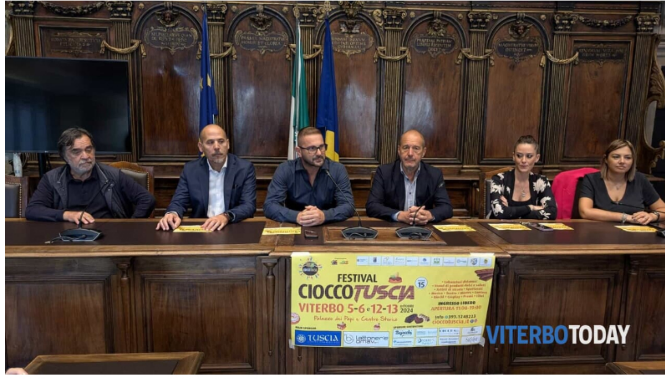
La conferenza di presentazione

Nei primi due weekend di ottobre torna la mostra mercato nelle scuderie di palazzo dei papi